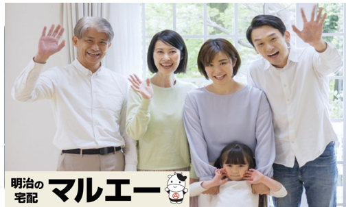
明治の 宅配 マルエー