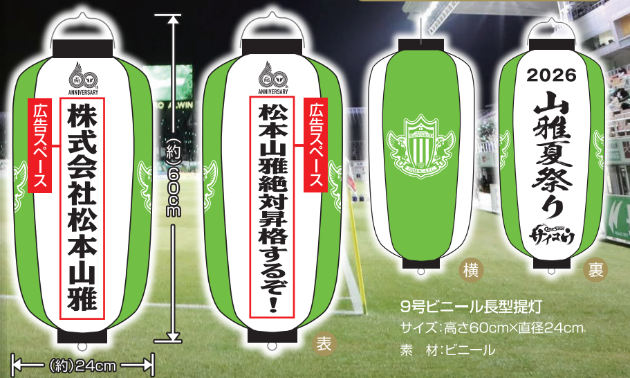
9号ビニール長型提灯 サイズ:高さ60cm×直径24cm 素材:ビニール