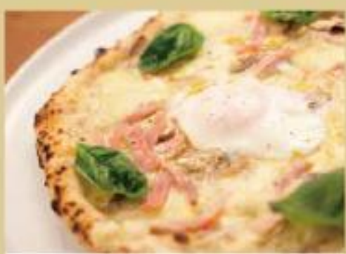
ピスマルク ¥900 (モッツアレラチーズ、ハム、卵、バジル)