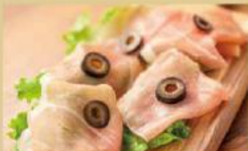
生ハム盛り合わせ ¥560