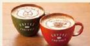
カフェラテ、カプチーノ、キャラメルラテには YAFFY またはカップマークのラテアートが、