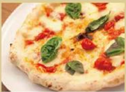
マルゲリータ ¥800 (トマトソース、モッツアレラチーズ、バジル)