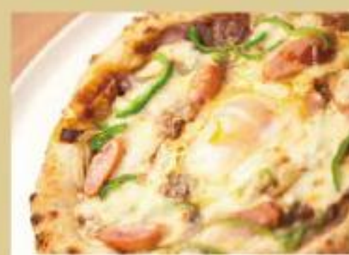
カレーピッツァ ¥950 (カレーソース、卵、モッツアレラチーズ)