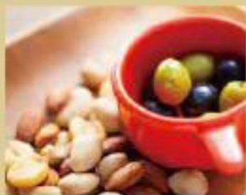
オリーブ&ミックスナッツ ¥470 オリーブ ¥280 / ミックスナッツ ¥300