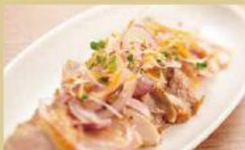
信州オレイン豚炙り味噌風味スライス ¥560