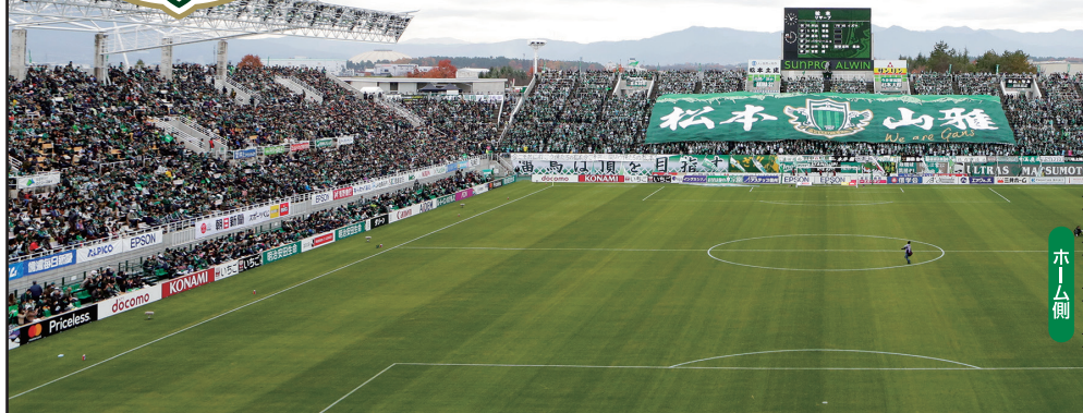
■サンプロ アルウィン 座席表