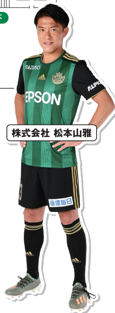
株式会社 松本山雅